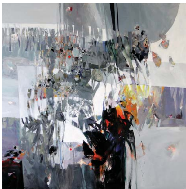
Residuo vegetal, 2012

2007 Premio Maestro Domingo Chávez. Punto Fijo Día del Artista Plástico. / Homenaje en el Ateneo de Cabudare, honrando a Chirinos al darle su nombre al salón. / Ciudadano Ilustre de la ciudad de Cabudare. 2005 Reconocimiento por la participación en la primera subasta de FUNDANA en Ciudad Banesco, Caracas. 1996 Botón Ciudad de Barquisimeto en su Segunda Clase Concejo Municipal del Municipio Iribarren, Barquisimeto, Venezuela. 1994 Primer Premio. Salón Municipal de Caracas. Alcaldía del Departamento Libertador. Caracas, Venezuela. 1992 Premio Salón Municipal de Maracay, Venezuela. / Premio Papeles Maracay. XI Salón Municipal de Pintura. Galería Municipal de Arte de Maracay, Venezuela.