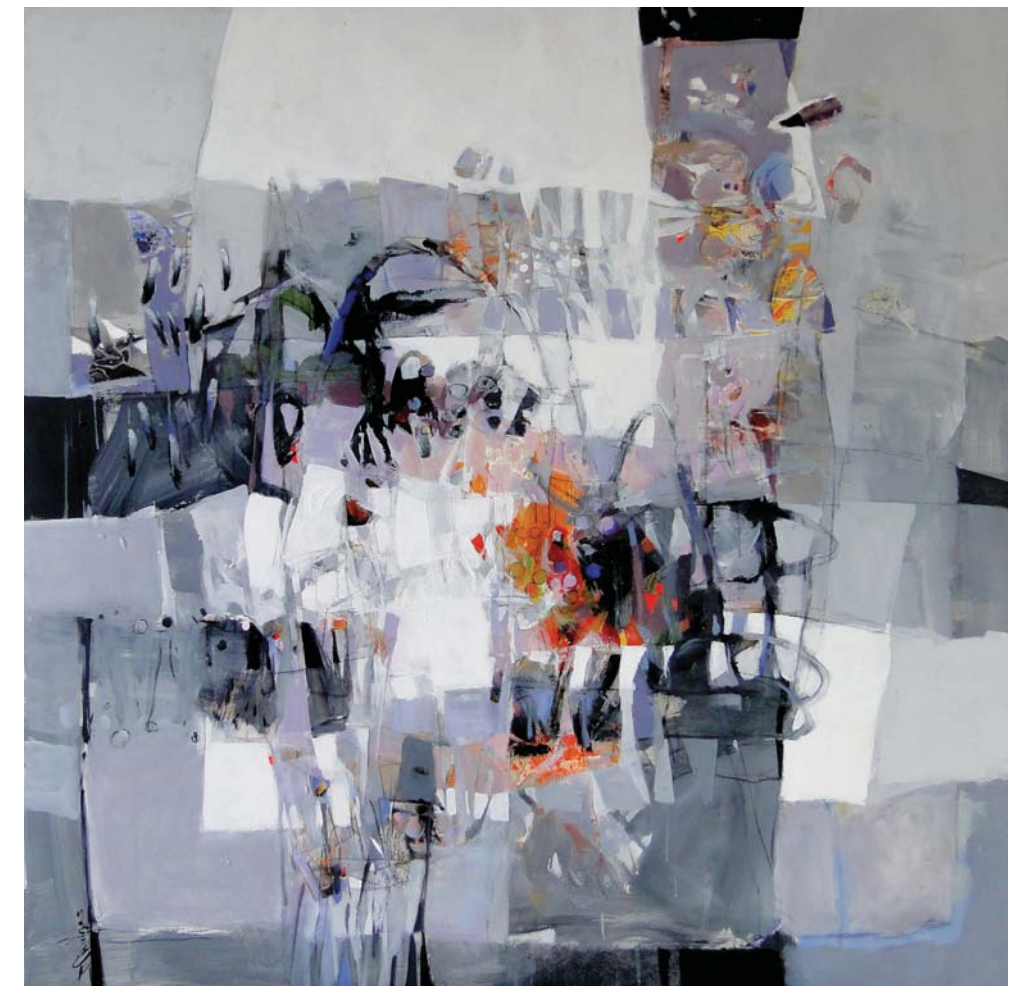
Canto lírico de un viñedo, 2012