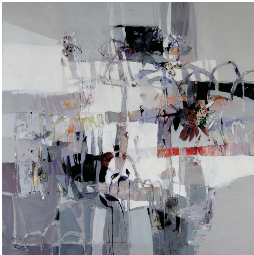
Vientos de primavera, 2012