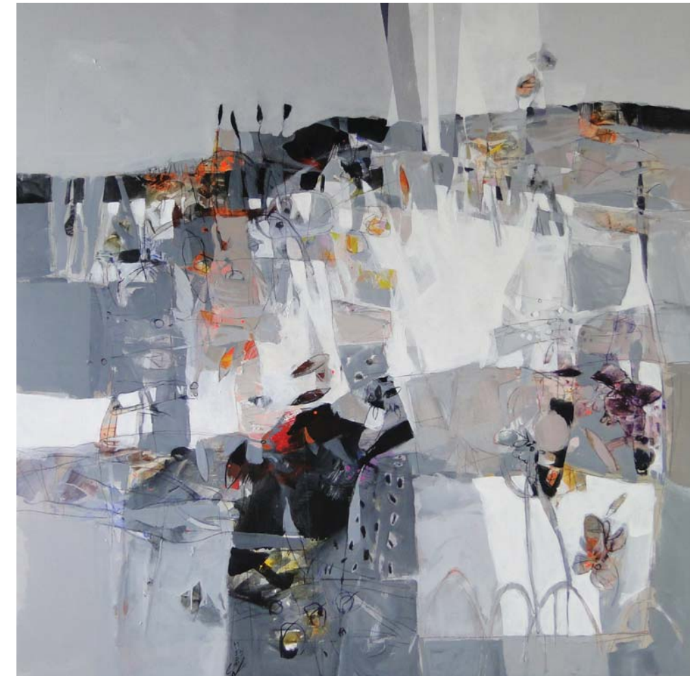
Fragmento de primavera, 2012