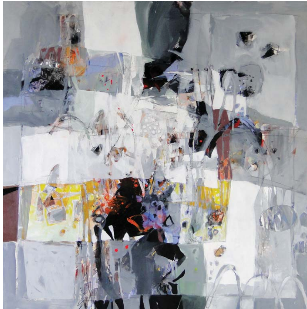
Fragmento de un amanecer, 2012

En esta nueva serie, sucesiones de franjas horizontales y verticales, se animan gracias a ligeros movimientos virtuales y a su fraccionamiento en secciones de ritmos contrapunteados, semejantes a la estructura del patchwork . Manchas de fuertes colores, expresiones visuales que semejan flores y otras formas vegetales, en rojos, verdes, amarillos, emergen desde lo más profundo de la tela, posesionándose de la superficie pictórica al igual que abstracciones sintetizadas de la naturaleza. Chirinos se revela como gran colorista con un tema ligado a la exuberancia natural. De esta exuberancia, extrae fragmentos que ordena en contenidos significativamente expresivos y abstractos. A partir de este proceso, logra una nueva manera de expresar su creatividad y sensibilidad ante un universo que siempre le ha apasionado.